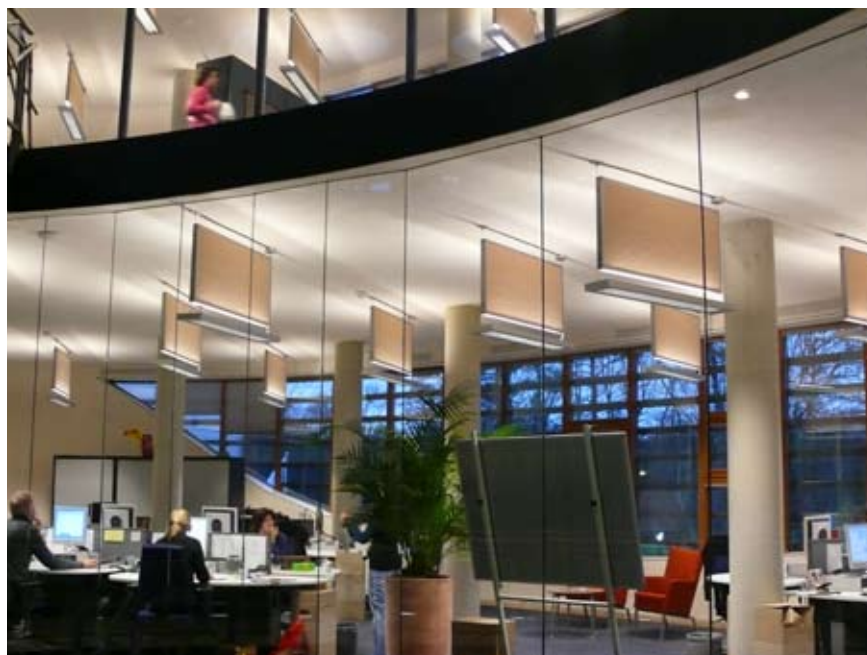
Soundstone baffles, kantoorpand WNF

De baffles worden door middel van snelhangers verticaal aan dak, plafond of hulpconstructie opgehangen. Ook is het mogelijk om de baffles met speciale beugels horizontaal tegen het plafond of direct tegen de wand te monteren. De beugels zorgen voor een afstand van 5 cm tussen de ondergrond en de baffle waardoor de geluidsabsorptiewaarde in de lagere frequenties verbetert. Voor bevestiging aan wand of plafond zijn per standaard baffle twee beugels of snelhangers nodig.