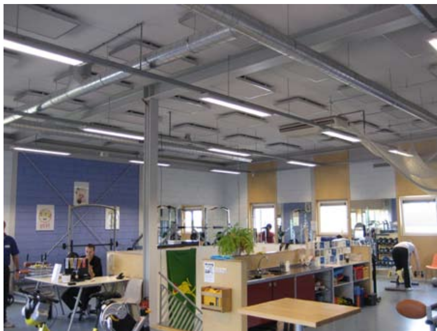
Soundstone baffles, Fysioworkshop Houten