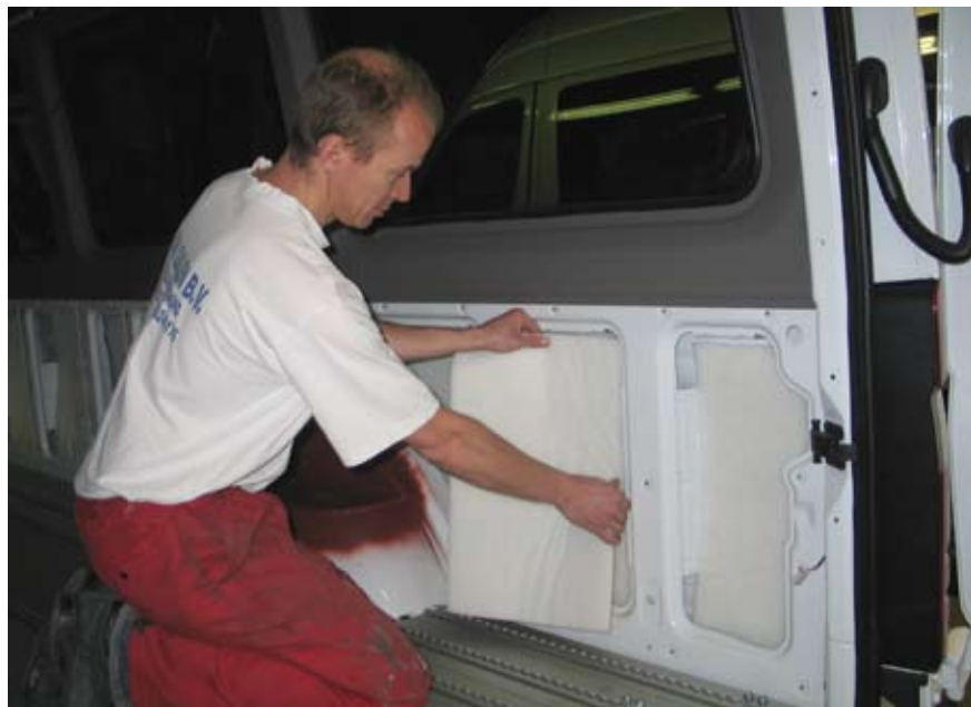
Akotherm in een bedrijfsbus